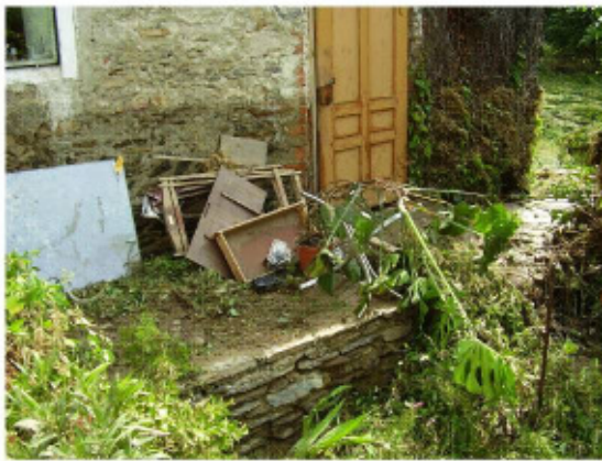
(III P7010521) Allerlei Gerümpel im kleinen Garten, an stilleren Ecken abgelagert.

Völlig niedergeschlagen stieg ich aus dem Bett, ging nach oben (ich schlief wegen der Hitze im kleinen Zimmer des Parterres, neben dem Hobby Raum) und legte mich völlig entmutigt, ohne meine sonst übliche Morgentoilette hinter mich gebracht zu haben, neben meine Frau ins Ehebett. Die Geschichte ist bezeugt, da ich diese zwar meiner Gattin vorerst nicht erzählte, aber ihr wiederholt sagte, dass ich einen Albtraum gehabt hätte, darum jetzt völlig bedrückt und entmutigt wäre und dass ich schon lange keinen derart mich deprimierenden Traum gehabt hätte.