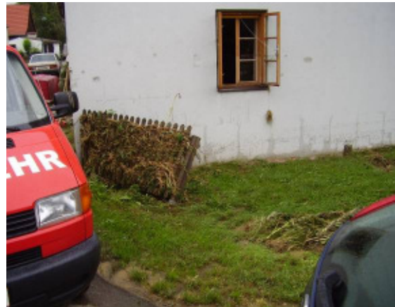
(I 502) Das Wasser hat den Gartenzaun mitgenommen.

Das reißende, rasch heranschießende Hochwasser nahm alles mit, wo es was fand und freien Lauf hatte, vermengte sich mit bereits mitgebrachten Gerümpel oder stapelte alles auf einen Haufen zusammen.