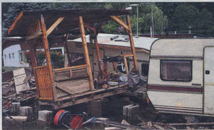
Ein Bild der Verwüstung bot auch der Campingplatz Drosendorf, wo die Thaya auch einige Wohnwägen einfach wegspülte.

Martin war mit dem Traktor in Fronsburg und hat u. a. die total verschmutzten Teppiche mit nach Sigmundsherberg genommen.