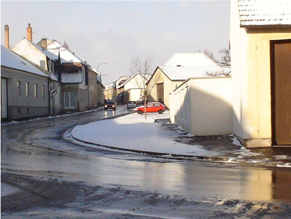
Ein freier Blick für alle Straßenbenützer, zwei breite Gehsteige und ein Grünstreifen der momentan von Schnee überdeckt ist.

Am 16 November 2004 konnten die Arbeiten des Abbruches, des Wieder- Aufbaues und der frischen Kurvenführung mit den frischen Gehsteigen abgeschlossen werden. Die Ortsbewohner freuen sich besonders über den verbreiterten Fußweg auf der Südseite. Für die Fahrzeugbenützer wurde die Biegung übersichtlicher und damit entschärft. Es ist nur zu hoffen, dass diese Neuerung nicht zum Schnellerfahren missbraucht wird. Einer besonderen Gruppe von Fußgängern (aus dem östlichen Ortsteil) wird ein funkelnagelneuer Gehsteig (entlang der Wand des Hauses Zotter) angeboten. Er ist in erster Linie für Kirchgänger, Arztbesucher und für die Kleinen des Kindergartens mit ihren Begleitpersonen gedacht. Ob man diesen auch nützt, wird die Zukunft zeige.